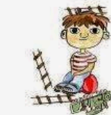
Scarsa creatività e uso inappropriato dei giocattoli