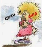
Nei momenti di crisi ha comportamenti autolesionistici o lesionistici.