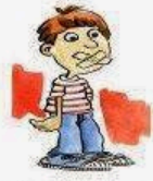
Difficoltà ad esprimersi parlando