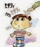
Mostra indifferenza iper-sensibilità o scarsa reazione ai rumori e/o al contatto fisico