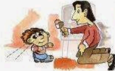
Carenza nello sguardo e nel contatto visivo