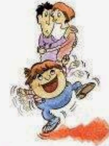
Comportamenti strani e bizzarri