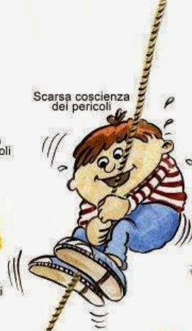
Scarsa coscienza dei pericoli