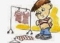
Non ama i cambiamenti