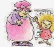
Per chiedere si serve della mano dell'adulto.

Una diagnosi precoce è comunque fondamentale per sviluppare le potenzialità di una persona con autismo.