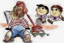
Difficoltà nell'interazione con altri bambini