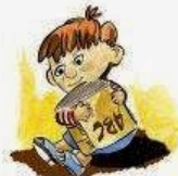
Strani attaccamenti agli oggetti.