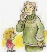
Parla sempre dello stesso argomento e tende a ripetere le parole a pappagalò.