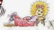
Fissa e ruota gli oggetti